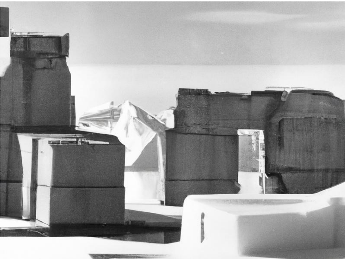
Aus recht massiven Blöcken erstellte Baureste