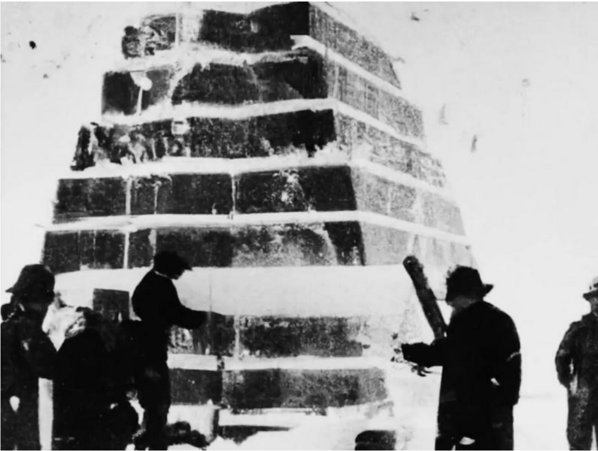
Eine Minipyramide - oder was soll es sein?