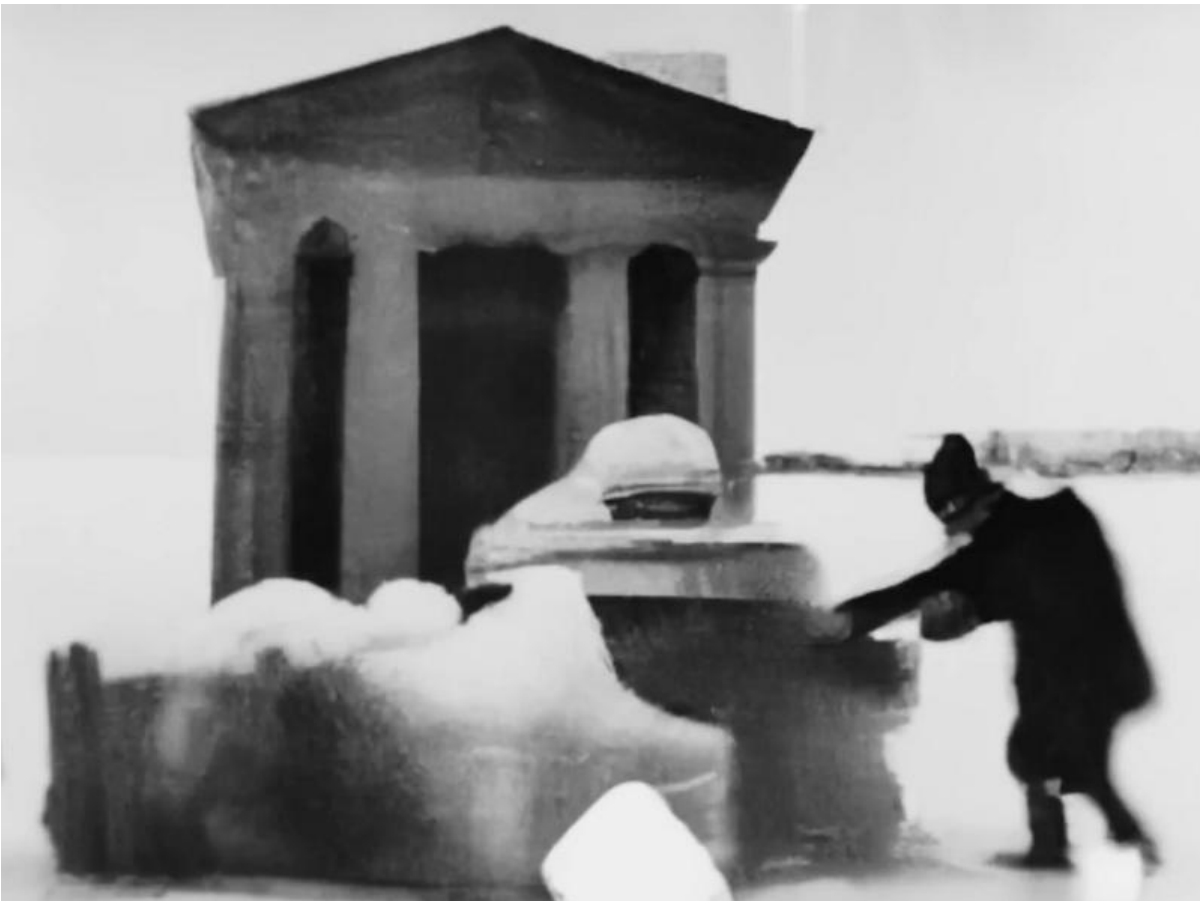
Wirkt fast griechisch