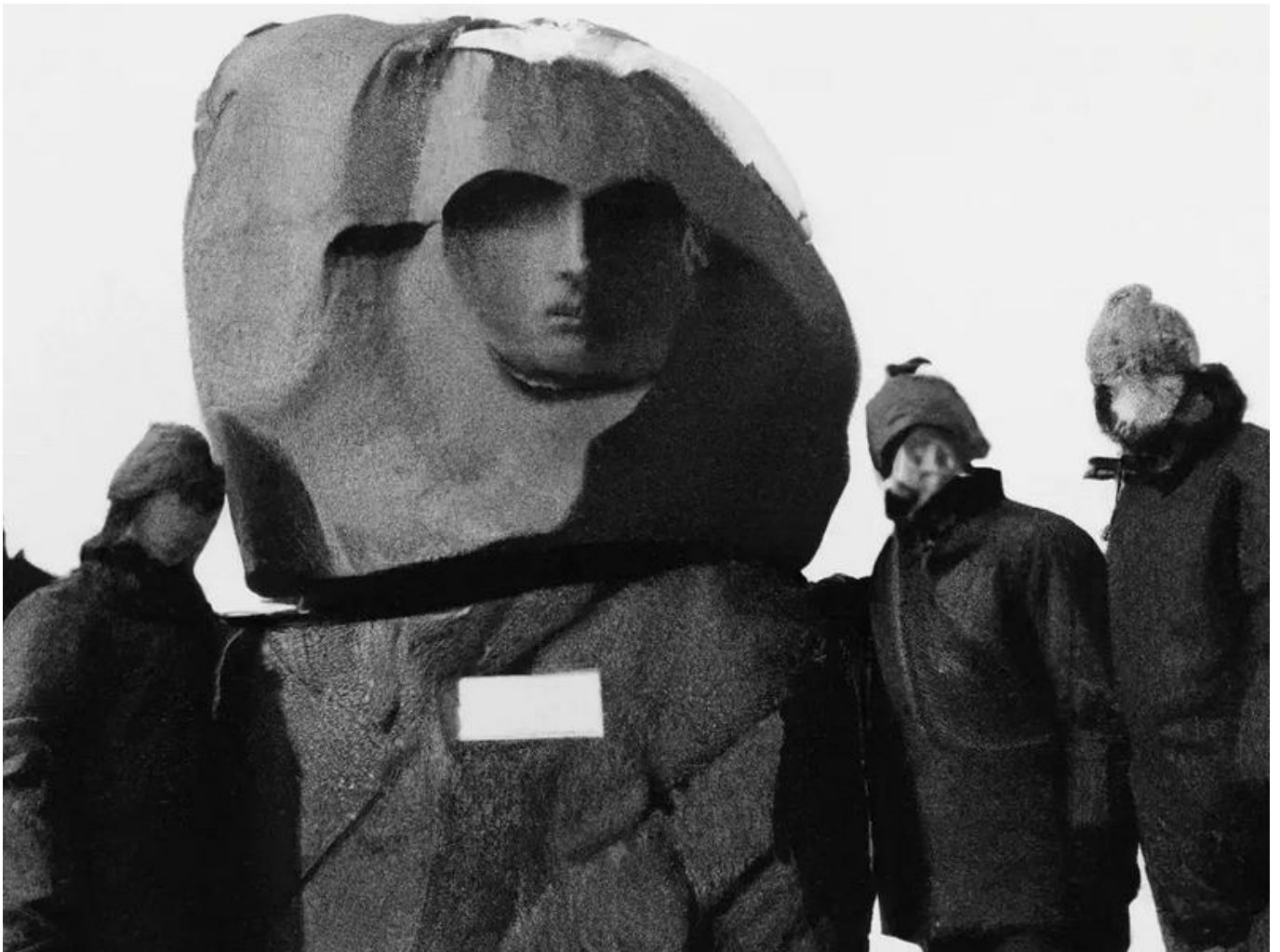
Drei Forscher neben einem behauenen Stein, welcher ein uns vertrautes menschliches Antlitz zeigt

Nachfolgend werden einige Steinskulpturen gezeigt. Es handelt sich dabei um humanoide Darstellungen, von denen aber einige deutlich von unserer Art abweichen.