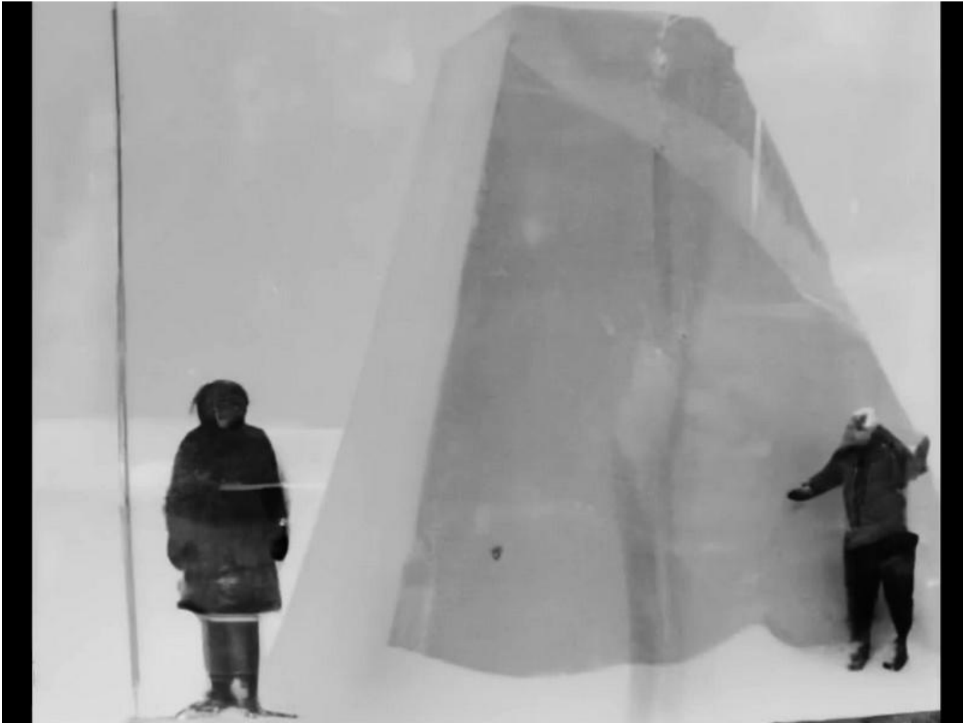
Ein über fünf Meter hoher Monolith