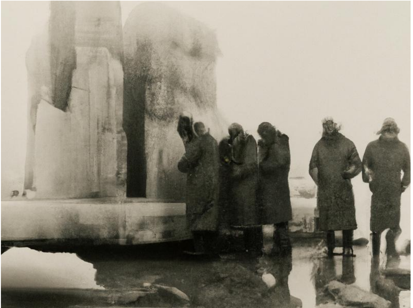
Sechs Forscher vor einem massiven Koloss (was auch immer dieser darstellen soll)

Teil 1: High Jump (geheime Fotos) [eine Einführung]