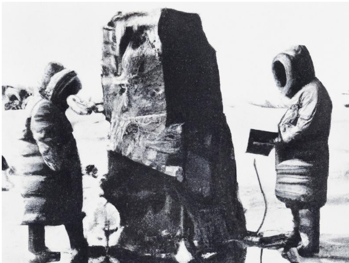
Ein über zwei Meter hoher Steinblock