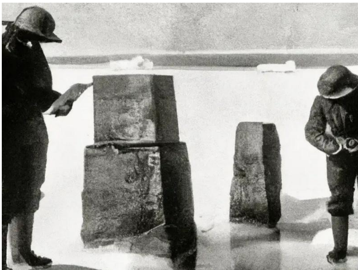
Zwei Steinblöcke. Ich vermute, dass auf diesen feine Reliefs angebracht wurden