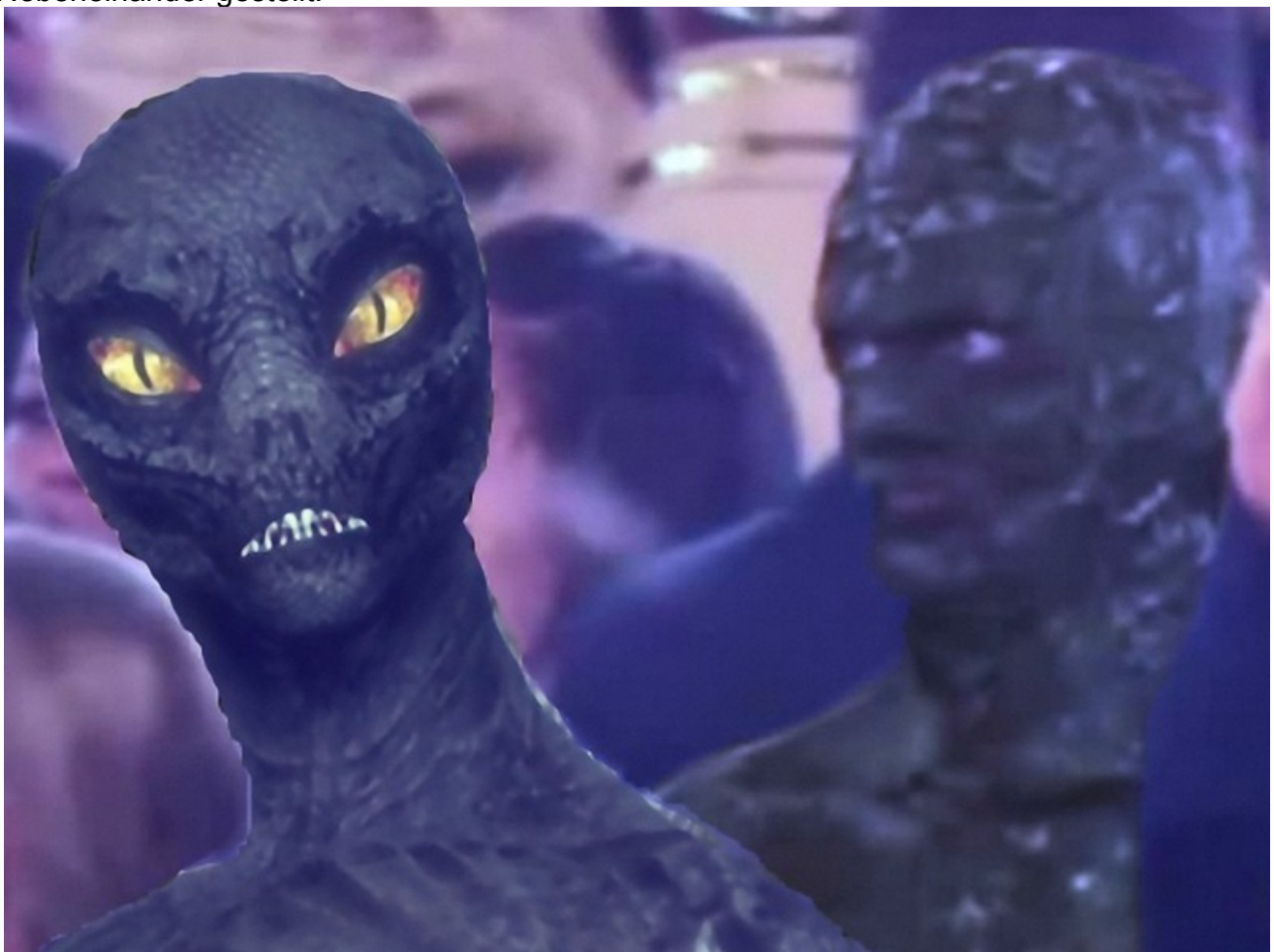
Bei den Reptoiden jeweils den Bildkontrast etwas abgeändert