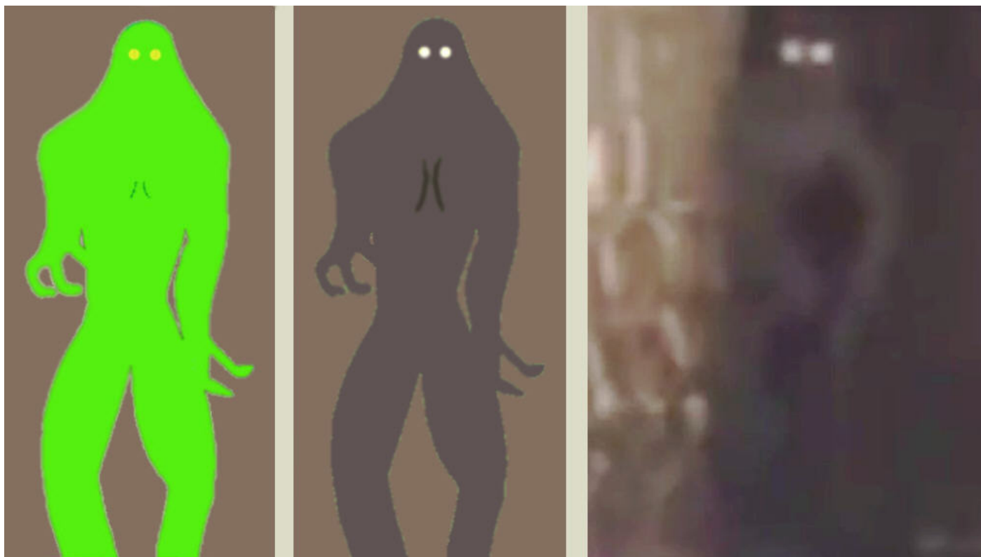
Links: Originalfarben aus der Zeichnung Mitte: Mit der Farbgebung des Videos Rechts: Videoschnappschuss

Die Größe des Wesens lässt sich nur schwer abschätzen, doch 1,8 – 2 Meter könnten denkbar sein. Kleidung ist am Wesen nicht erkennbar, ansonsten handelt es sich zweifellos um ein humanoides Geschöpf, mit Bewegungsabläufen, die zwar nicht denen eines Menschen entsprechen, aber sehr wohl zur Physiognomie des Wesens passen. Leider sind die Kontraste sehr schwach, weswegen man Arme und Beine nur vage erkennen kann. Diese lassen aber eine große Ähnlichkeit mit einem Repto erkennen und zwar solch eines Wesens, welches bei mir unter: http://www.fallwelt.de/reptos/reptokontakte.htm (in Sachsen) beschrieben wird.