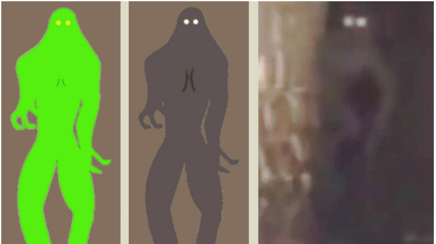
Links: Originalfarben aus der Zeichnung Mitte: Mit der Farbgebung des Videos Rechts: Videoschnappschuss

Die Größe des Wesens lässt sich nur schwer abschätzen, doch 1,8 – 2 Meter könnten denkbar sein. Kleidung ist am Wesen nicht erkennbar, ansonsten handelt es sich zweifellos um ein humanoides Geschöpf, mit Bewegungsabläufen, die zwar nicht denen eines Menschen entsprechen, aber sehr wohl zur Physiognomie des Wesens passen. Leider sind die Kontraste sehr schwach, weswegen man Arme und Beine nur vage erkennen kann. Diese lassen aber eine große Ähnlichkeit mit einem Repto erkennen und zwar solch eines Wesens, welches bei mir unter: http://www.fallwelt.de/reptos/reptokontakte.htm (in Sachsen) beschrieben wird.